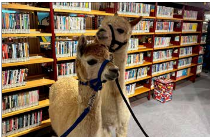
Das Weihnachtsmärktchen lockte ganz neue Besucher an.

Ein Tag voller vorweihnachtlicher Aufregung war für uns der 1. Dezember. Wir öffneten das erste Adventskalendertürchen mit einem Weihnachtsmärktchen an und in der Bibliothek. Eine Premiere für uns! Draußen gab es nach der musikalischen Eröffnung durch die Oberlandknirpse bei Weihnachtsmusik und Feuerkörben kulinarische Angebote, in der Bibliothek Basteltische, Deko-Verkauf, Wunschzettelbriefkasten und Vorlesecke. Im Veranstaltungsraum wurde die Pokémon-Karten-Tauschbörse förmlich überrannt und ausnahmsweise gab es hier auch einmal Bücher zu kaufen. Auch Spielzeug fand neue kleine Besitzer. Der Weihnachtsmann drehte seine Runden – doch nicht nur er: auch zwei neugierige Alpakas vom Alpakahof Staritz schauten zwischen den Bücherregalen vorbei. Wir bedanken uns ganz herzlich bei allen Mitwirkenden aus dem Ort für ihre kreativen Angebote und bei allen Helfern in der Vor- und Nachbereitung des Märktchens.