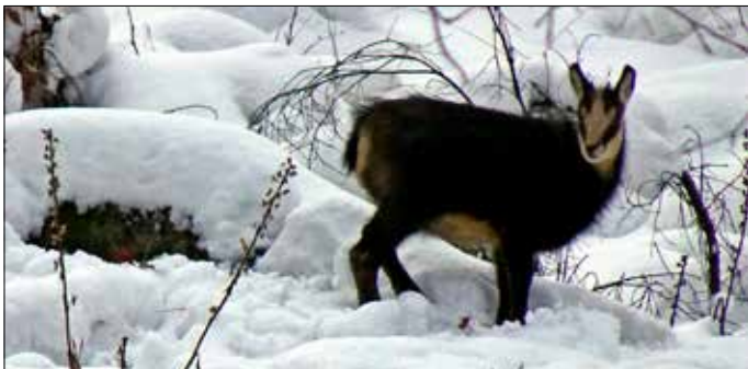
Junge Gämse im Winterfell