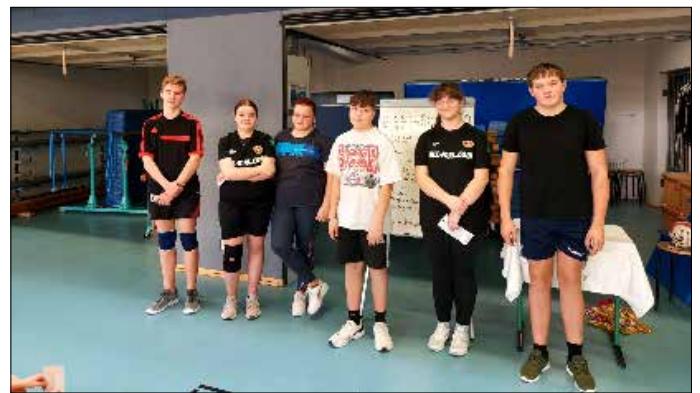
Beste Spielerinnen und Spieler der einzelnen Klassen