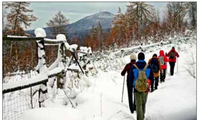
Aufstieg mit Blick zum Tannenberg, Fotos: Peter Hennig