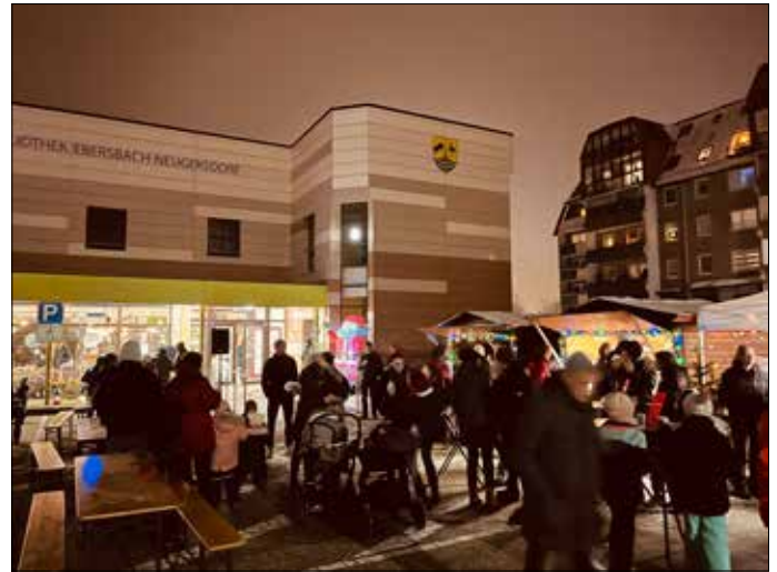
Gemütliche Stimmung rund um die Stadtbibliothek am 01.12.23

Im Januar wird wieder gequatscht: Wir laden am 15.01.24 zur ersten Bücherquatschrunde des Jahres ein. Los geht es um 18:30 Uhr in der Blockstube in der Stadtbibliothek. Bringen Sie gerne „ein gutes Buch“ mit, das Sie den anderen Gästen empfehlen möchten, oder hören Sie einfach zu. Die erste Kinderbuch-Quatschrunde findet dann am 01.02.24 um 16:00 Uhr im Kinderbereich statt. Kinder können gerne dabei sein, zuhören oder schmökern.