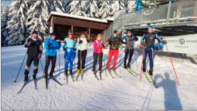
In Horny Misecky (Riesengebirge) fanden unsere Erwachsenen perfekte Trainingsbedingungen vor