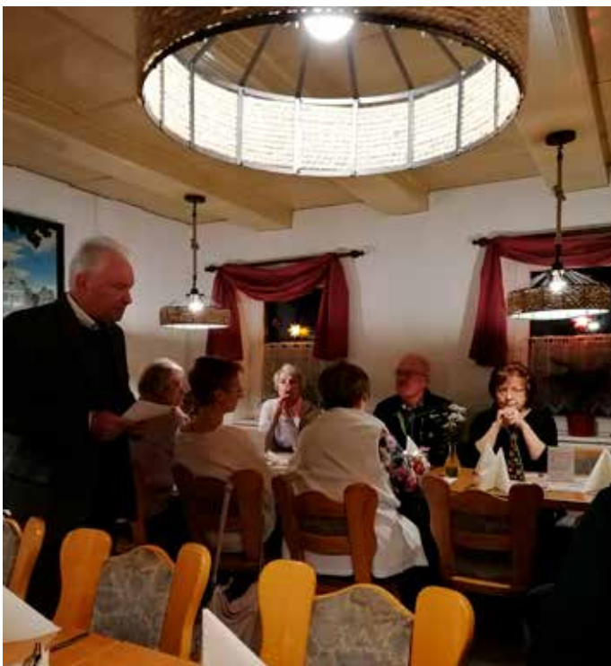
Tag des Ehrenamtes