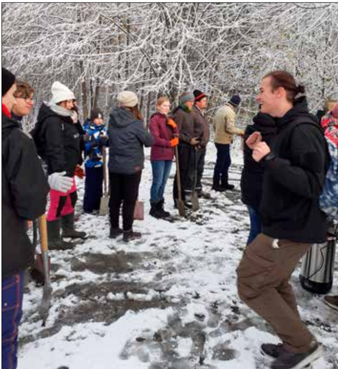
Es kann losgehen!